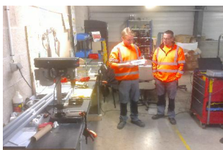
Poste de montage 1er run

Implantation et pilotage de l'atelier par les stagiaires, avec plusieurs postes de fabrication et de montage, dans une logique de flux