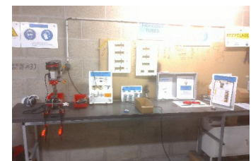
Poste de montage Run final